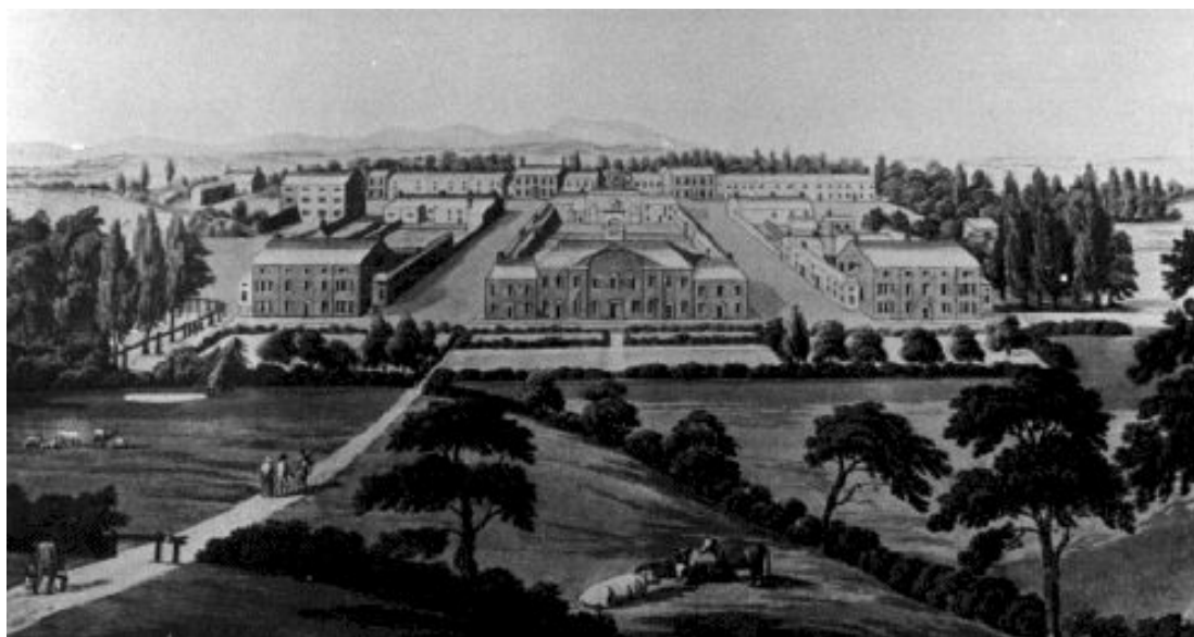
Dibuix de Droylsden en 1847, obtingut del Millennium Yearbook of Droylsden