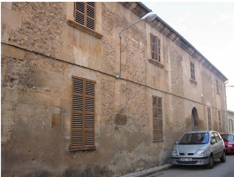
Façana principal del Casal de la Jornada