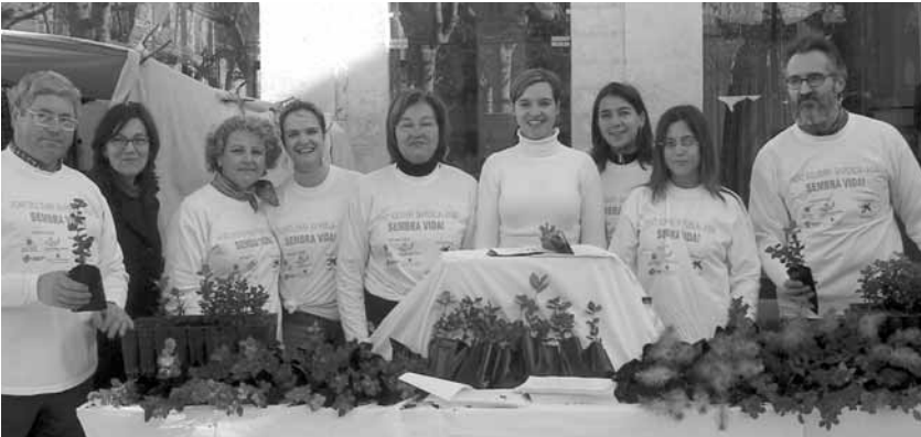
Voluntaris i membres de la Comissió Municipal de Cooperació

El passat dia 23 de gener es va celebrar a sa Pobla una campanya solidària que, sota el títol "Pont Solidari Sa Pobla-Àsia. Sembra Vida!", va tenir com a principal objectiu recaptar fons per ajudar els damnificats del tsunami que va arrasar les costes del sud-est asiàtic a finals del passat mes de desembre. L'esmentada campanya, organitzada pel consistori pobler, va comptar amb l'activa participació de la Comissió Municipal de Cooperació –membres de la qual actuaren com a voluntaris- i amb el suport de la Conselleria de Medi Ambient, l'organització no governamental "Apotecaris Solidaris" i l'entitat bancària "La Caixa". En el decurs de la jornada es varen entregar, als nombrosos ciutadans que s'interessaren per la iniciativa solidària, arbres cedits per la Conselleria de Medi Ambient, a canvi d'una aportació econòmica de 2 euros, evocant d'aquesta manera la idea de recuperació de les zones devastades mitjançant el símbol de sembrar un nou arbre.