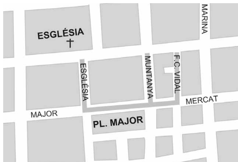
trams de vies afectades per la primera fase de les obres

Les obres de nova pavimentació del centre urbà del poble han començat aquest mateix mes de febrer, una vegada que el consistori adjudicà les obres de la primera fase a l'empresa Coexa per un import de 789.000 euros, en el decurs d'un ple extraordinari celebrat el passat dia 21 de gener. El batle de sa Pobla, Antoni Serra, va justificar la necessitat de convocar un ple amb caràcter extraordinari en el compromís adquirit pel consistori amb els comerciants i els veïns de les àrees urbanes afectades, en el sentit que les obres hagin acabat abans de les festes de Sant Jaume, el proper mes de juliol.