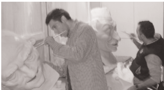
Membres d'es Grif pintant els caparrots

Amb motiu de les properes festes de Nadal i Cap d'Any, l'Associació per a la integració de minusvàlids "Es Grif" vol fer una nova crida a totes les persones de sa Pobra que pateixen algun tipus de discapacitat, perquè participin activament d'aquestes dates tan especials i, per tant, que no deixin que les seves circumstàncies personals les marginin de l'ambient general de festa que es viuran durant aquestes setmanes en el nostre poble. Per aquest motiu, l'esmentada associació vol recordar que té les seves portes obertes per a totes aquelles persones que viuen a sa Pobra i que es troben en aquesta situació, ja que l'objectiu de l'entitat –fundada el 1992 i que ha estat guardonada amb l'escut d'or de sa Pobra corresponent a aquest any 2006- és precisament ajudar a aquest col·lectiu amb dificultats derivades de qualque discapacitat, evitant que caiguin dins la marginació i potenciant la seva integració social mitjançant un extens programa d'activitats, teràpies i converses amb gent que realment tengui un esperit solidari.