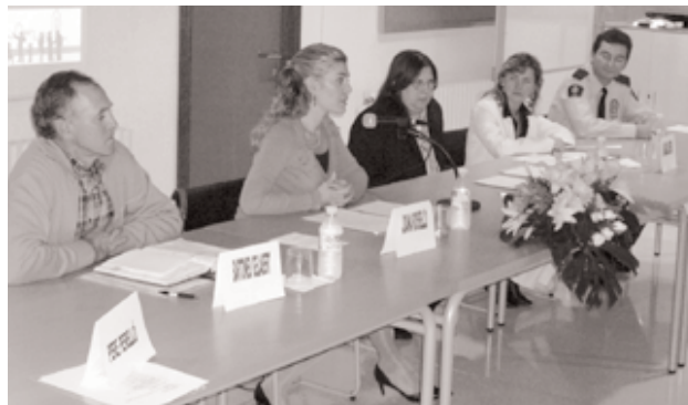
Presentació de la memòria del policia tutor 05-06

El passat dia 8 de novembre es va presentar a l'edifici Can Peu Blanc de l'IES sa Pobra la memòria del policia tutor corresponent a les tasques dutes a terme al llarg del darrer curs escolar 2005-2006.