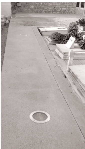
Nova pavimentació. Nova il·luminació. Solució a les barreres arquitectòniques