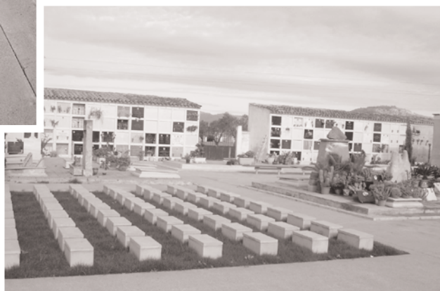
Nou columbari per a les restes d'incineracions