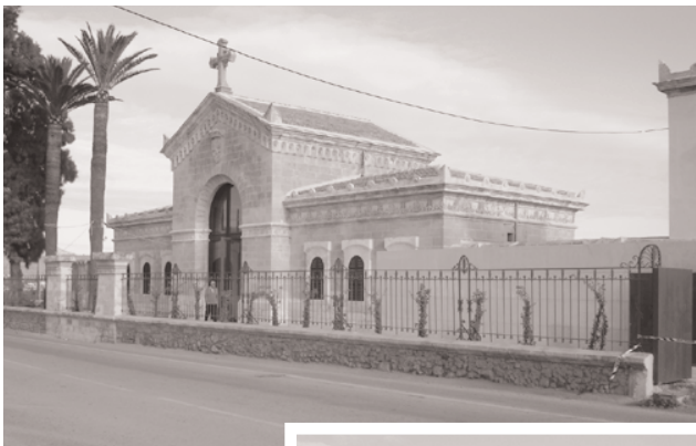
Accés lateral i reforma integral del tanatori, per a la millora dels serveis funeraris