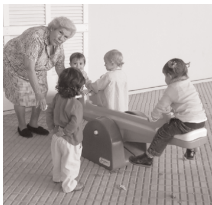
Infants de l'escoleta i residents compartint moments d'esplai

Des de fa ja unes setmanes, un grup de persones majors de la residència Huialfàs de sa Pobra participa en un innovador programa educatiu de l'Escoleta Municipal, en virtut del qual aquestes persones acudeixen tres dies per setmana a l'esmentat centre escolar per compartir una estona amb els nins i nines de 0 a 3 anys durant el temps d'esplai. Es tracta, com deim, d'una iniciativa pionera a sa Pobra i que està tenint un notable èxit, ja que permet als més grans compartir un temps de jocs i d'intercanvi afectiu amb nins i nines petits que, de fet, estan rebent aquest contacte amb els "padrins i padrines" amb clares mostres d'acceptació i afecte. Al mateix temps, gràcies a aquesta