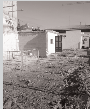
Emplaçament de la planta, devora la Torre de l'Aigua

Aquest darrers dies han començat les obres de la nova planta potabilitzadora, que estarà ubicada al costat de la popular Torre de l'Aigua- devora Sa Graduada- i que permetrà, finalment, donar una resposta definitiva al problema derivat de la presència de nitrats i altres substàncies a l'aigua de l'aixeta i, en conseqüència, garantirà el subministrament d'una aigua potable de qualitat als ciutadans de sa Pobra. Aquest projecte ja fou anunciat a principis del passat estiu pel batle de sa Pobra, Antoni Serra, i es considera la millor solució per a un problema de salut que preocupa els veïns poblers i que ha motivat la publicació d'una sèrie de bans informatius, per part del consistori, en què es detallen tot un seguit de recomanacions relacionades amb el consum de l'aigua de l'aixeta en el nostre poble. Es tracta, per tant, d'un problema que es confia que desapareixerà definitivament d'aquí a uns tres o quatre mesos, quan entri en funcionament la nova planta. Els cost de les obres és de poc més de 1.600.0000 euros, i serà finançat a parts iguals pel consistori pobler i la conselleria de Medi Ambient del Govern de les Illes Balears.